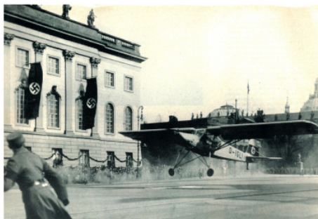
F1 156 V 2 nach Umbau im März 1939 am "Tag der Winternacht" vor der Neuen Wache in Berlin Unter den Linden.